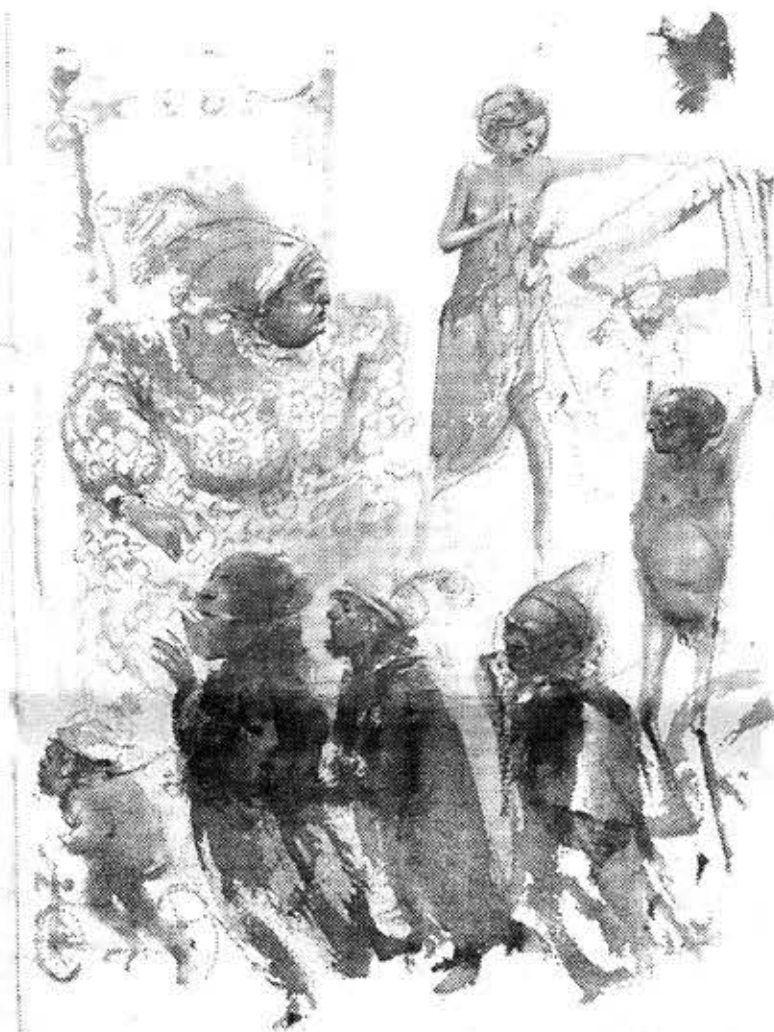
Ilustración Roberto Fabelo